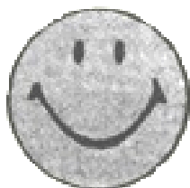
Originální smajlík z roku 1972

Za "vynálezce" smajlíků je považován francouzský novinář Franklin Loufrani. Ten poprvé použil smajlíky v novinách 1. ledna 1972. Pod jeho patronací se smajlíci šířili do dalších francouzských a evropských novin, kde označovali především dobré zprávy. Jejich počet narůstal a nyní je smajlík jednou z nejznámějších, nejsrozumitelnějších a nejrozšířenějších ikon.