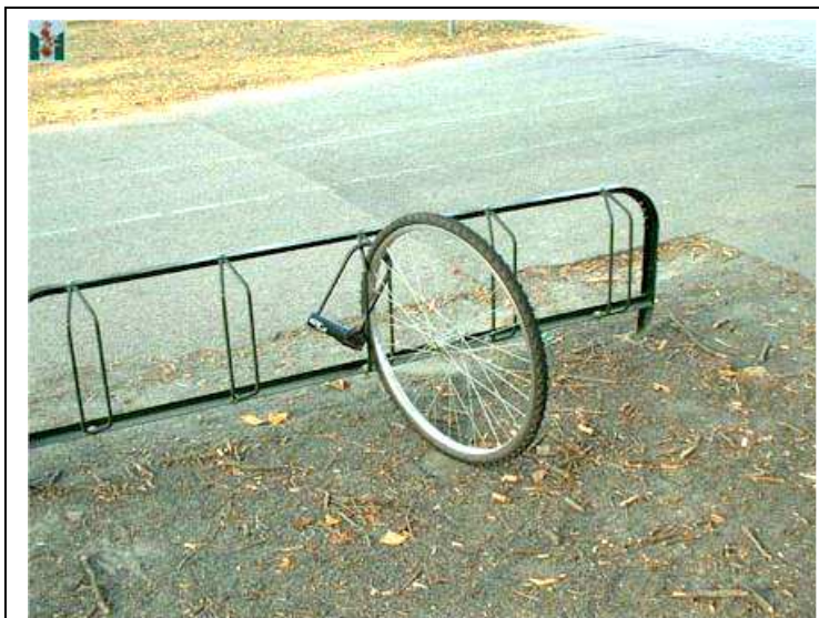
Nezapomínejte si zamykat kolo, krade se

Radši svému dítěti budu číst před spaním v matematicko-fyzikálních tabulkách! Každého, kdo mi bude podstrkovat podobnou dětskou knížku, praštím! Peškem!